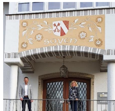
Politischer Besuch im Rathaus

Daniela Ludwig, Mitglied des Bundestages, besuchte am 01.12.2020 das Rathaus Soyen, um den neuen Bürgermeister persönlich kennenzulernen und sich über aktuelle Themen auszutauschen. Der geplante Termin für die nächste Sitzung des Arbeitskreises Dorferneuerung Bahnhofsgelände wurde auf 14.01.2021 festgelegt.