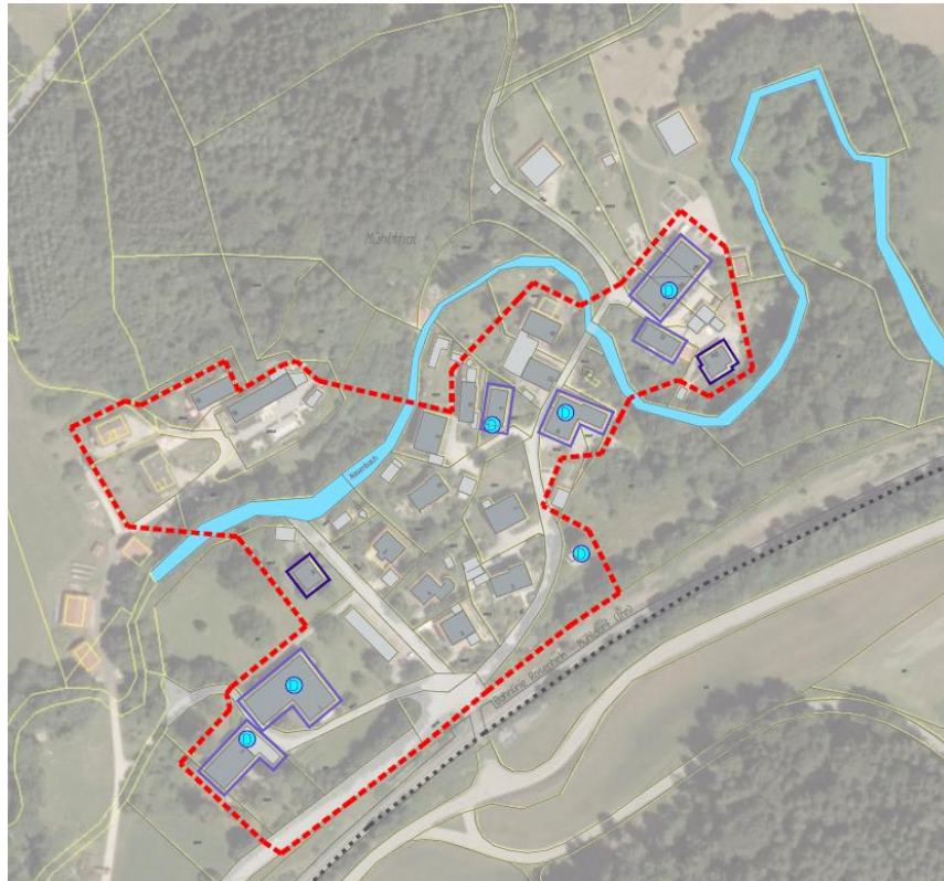
Fördergebiet Dorferneuerung Mühlthal schließt sich den Grenzen der Außen- und Einbeziehungssatzung für den Ortsteil Mühlthal an

festgelegt, dass sich das neue Fördergebiet maximal über die Flächen gemäß der Außen- und Einbeziehungssatzung für den Ortsteil Mühlthal erstrecken darf.