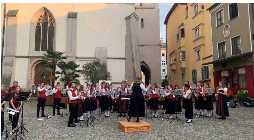
In 2022 nahmen 11 Jugendliche aus dem Gemeindebereich Soyen an der Jugendausbildung der Stadtkapelle Wasserburg a. Inn teil

Jugendarbeit der Stadtkapelle in 2022 mit 880 EUR.