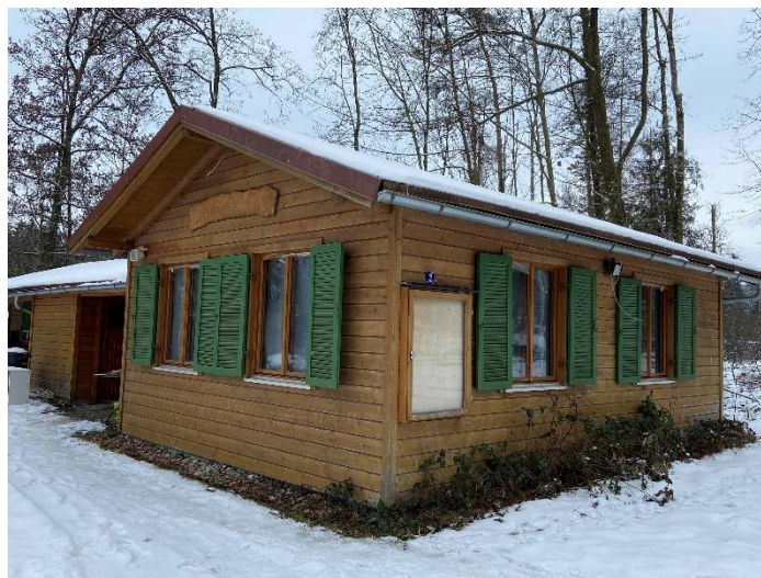
Der Lehrbienenstand in Wasserburg wird mit viel Eigenleistung renoviert

Als zertifizierte "Bienenfreundliche Gemeinde" fand auch der Antrag des Bienenzuchtvereins Wasserburg e.V. im Gremium Zuspruch. Renoviert wird derzeit der Lehrbienenstand in Wasserburg, der seitens des Bienenzuchtvereins Soyen genutzt wird. Die Grundsanierung der Schulungsräume einschl. der Sanitäranlagen wird mit 25.000 EUR veranschlagt, der Gemeinderat Soyen beschloss einen einmaligen Zuschuss in Höhe von 1.500 EUR.