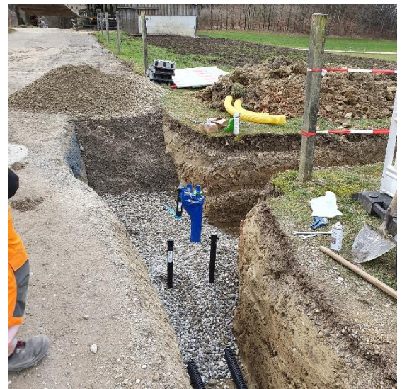
Die Maßnahme Umverlegung der Wasserleitung in Loderstätt ist abgeschlossen