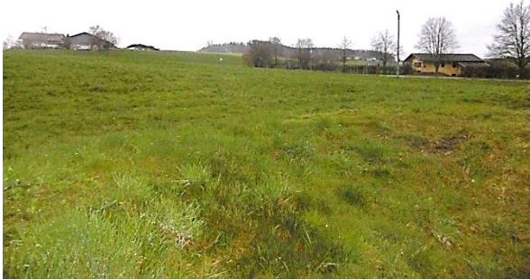
Abb. 5 Aussicht vom Bikepark-Gelände Richtung Lamsöd (Südost, 30.03.23)