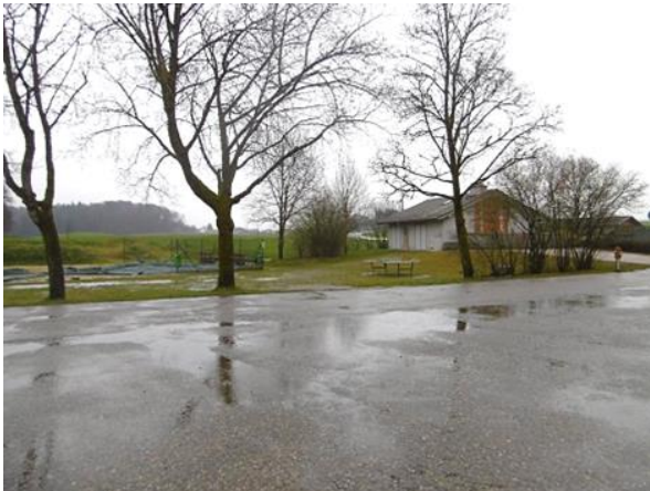
Abb. 7 Blick vom Parkplatz Richtung Südost mit Vereinsheim (30.03.23)