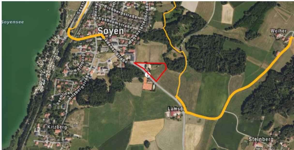
Abb. 10 Änderungsbereich (rot) mit örtlichem Wanderweg (gelb; unmaßstäblich)

Die Fläche liegt auf einer Höhe von ca. 493 m üNN und ist, unter Ausnahme des Bikepark-Geländes, nahezu eben. Bisher wird die Fläche als Freizeitgelände, Parkplatz und z.T. als Intensivgrünland genutzt (Abb. 10). Die nähere Umgebung ist durch Sportflächen, die Riedener Straße und weitere landwirtschaftliche Flächen geprägt. Nahe der Änderungsfläche verläuft ein örtlicher Wanderweg, ausgeschriebene Radwege befinden sich nicht vor Ort.