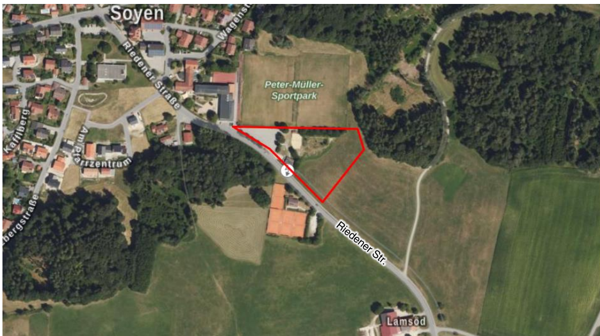
Abb. 1 Geltungsbereich der 18. Flächennutzungsplanänderung (rot), unmaßstäblich

Die vorliegende Bauleitplanung umfasst die 18. Änderung des gemeinsamen Flächennutzungsplans (FNP) für den Raum Wasserburg a. Inn, Gemeindegebiet und Gemarkung Soyen, Bereich Riedener Straße Nordost. Durch die Änderung soll eine bestehende Fläche für Gemeinbedarf vergrößert werden (Peter-Müller-Sportpark). Dazu soll die bisherige Fläche für die Landwirtschaft als Fläche für den Gemeinbedarf für „sportlichen Zwecken dienende Gebäude und Einrichtungen“ ausgewiesen werden. Das Areal von ca. 1,1 ha liegt im Bereich der Flurstücke Nr. 263/7, 255 Tfl., 265 Tfl., 376 Tfl., 377 Tfl. Die insg. 1,1 ha umfassen ein Jugendfreizeitgelände (Volleyballplatz, Bikepark; ca. 0,2 ha), ein Parkplatz (ca. 0,2 ha), eine Intensivwiese (ca. 0,55 ha) und Gehölzbestände (ca. 0,15 ha). Nördlich des Geltungsbereichs liegen zwei Fußballplätze, nordwestlich die Grundschule der Gemeinde Soyen.