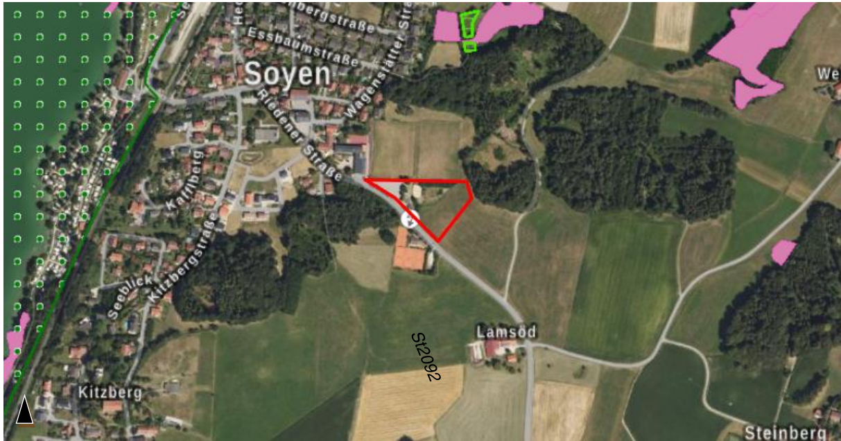
Abb. 2 Planungsgebiet (rot) mit Landschaftsschutzgebiet Soyensee (dunkelgrün punktiert), Flächen der Biotopkartierung (pink) und Ausgleichsflächen (hellgrün gestreift; Abb. unmaßstäbl., Luftbild: Bay. Vermessungsverwaltung 2022)

Von der Änderung sind keine gesetzlich geschützten Biotope i.S.v. § 30 BNatschG oder Art. 23 BayNatschG betroffen. Etwa 250 m nördlich des Plangebiets kommt gewässernah das Biotop Nr. 7839-0234 „Naßwiesenreste und -brachen östlich Soyen“ vor (LfU 1989; vgl. Abb. 2).