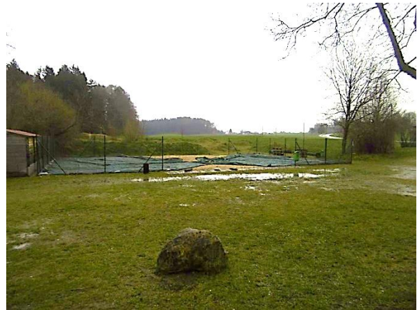
Abb. 6 Blick vom Parkplatz Richtung Osten (Volleyballplatz, 30.03.23)