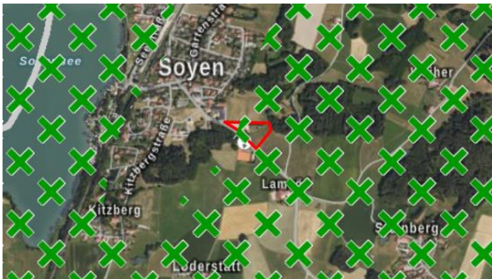
Abb. 4 Landschaftliches Vorbehaltsgebiet (grün gekreuzt)

Die Fläche liegt im Randbereich eines landschaftlichen Vorbehaltsgebiets. Schutzgebiete, Naturdenkmäler oder geschützte Landschaftsteile sind von der FNP-Änderung nicht betroffen.