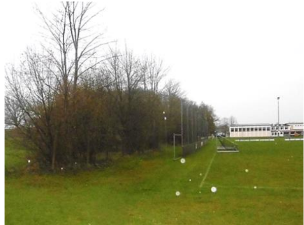
Abb. 8 Baumreihe entlang nördl. Grenze des Geltungsbereichs, Blickricht. Westen (30.03.23)