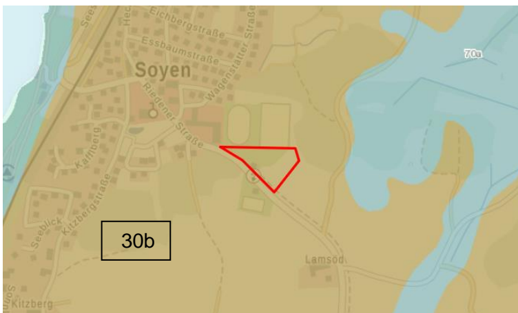
Abb. 11 Übersichtsbodenkarte 1:25.000 mit Vorhabensgebiet (rot; Bay. Vermessungsverwaltung)

Der Boden im Änderungsbereich setzt sich v.a. aus Braunerde, gering verbreitet Parabraunerde aus kiesführendem Lehm, über Schluff- bis Lehmkies zusammen (Abb. 11). Es handelt sich bereichsweise um humose Böden. Diese Bodenform besitzt eine hohe Nährstoffverfügbarkeit sowie ein mittleres Potential als Wasserspeicher. Bodendenkmäler und Geotope sind nicht von der Planung betroffen.