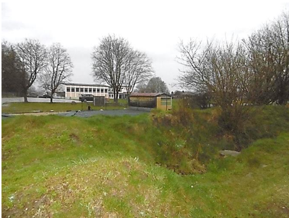
Abb. 9 Bikepark, Grundschule im Hintergrund, Blickricht. Westen (30.03.23)