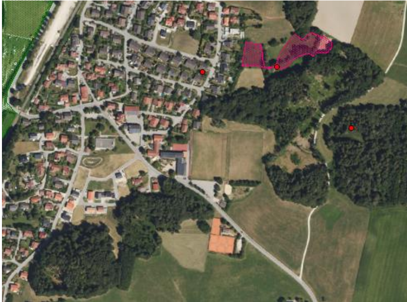
Abb. 3 Punkte der Artenschutzkartierung (1991-2007; rot) und Flachlandbiotopkartierung (2005; Fläche pink) (FIN Web, LfU, Stand 2023)