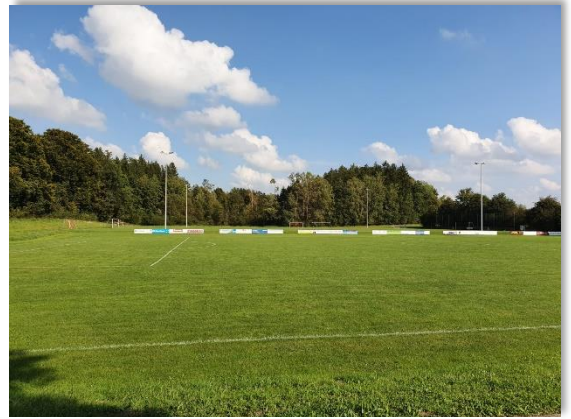
Die Sportplätze – schwer beansprucht durch Schüler, Spieler und Witterung – sind Dank kompetenter Pflege in einem sehr guten Zustand

Die Sanierung beinhaltet eine Dreifachdüngung, sodass im Frühjahr 2024 erneut natürliche Bodenverbesserer und Dünger benötigt werden. Aus diesem Grund wandte sich aktuell der Vorstand des TSV Soyen, Wolfgang Altinger, an den Gemeinderat mit der Bitte um Zusage, dass analog der Vorgehensweise in 2023 auch mit einer 50%-Beteiligung der Gemeinde an den Materialkosten für 2024 in Aussicht steht. Anlass für die frühzeitige Materialbestellung ist die bestehende Preisgarantie, die Zweitlieferung wird noch zu gleichen Konditionen wie im Frühjahr 2023 angeboten. Der Gemeinderat stellte den sehr guten Zustand der Rasenflächen fest und beschloss mit einem Dank für die hervorragende Pflege der Sportflächen einstimmig die gewünschte finanzielle Unterstützung für das kommende Jahr in Höhe von ca. 5.000 EUR.