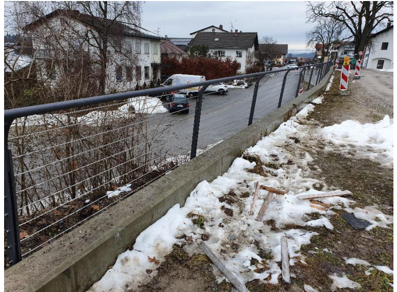
Das Geländer an der Stützwand in der Seestraße wurde angebracht

Anlässlich des Hochwassers fand eine Begehung mit Herrn Hofmann, GUVZV Rosenheim (Zweckverband zur Unterhaltung Gewässer III. Ordnung) statt. U.a. wurde der RO 40-Rohrdurchlass sowie verschiedene Nasenbachbereiche angeschaut. Der Wasserablauf ist geregelt; im Frühjahr ist ein Vegetationsrückschnitt und die Beseitigung von Baumbruchschäden geplant.