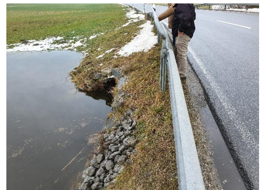
Der Hochwasserabfluss läuft geregelt