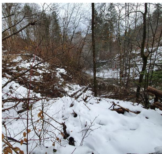
Der Hangrutsch im Bereich Edmühle

Auch der Bereich Hangrutsch in Edmühle wurde gemeinsam mit dem Vertreter der GUVZ besichtigt. Der Vorsitzende zeigte entsprechende Fotos. Der Hangrutsch verstärkt sich infolge Unterspülung, es sind entsprechende Beschilderungen in diesem Bereich aufgestellt. Die Bahn wird noch einmal über diesen Sachstand informiert.