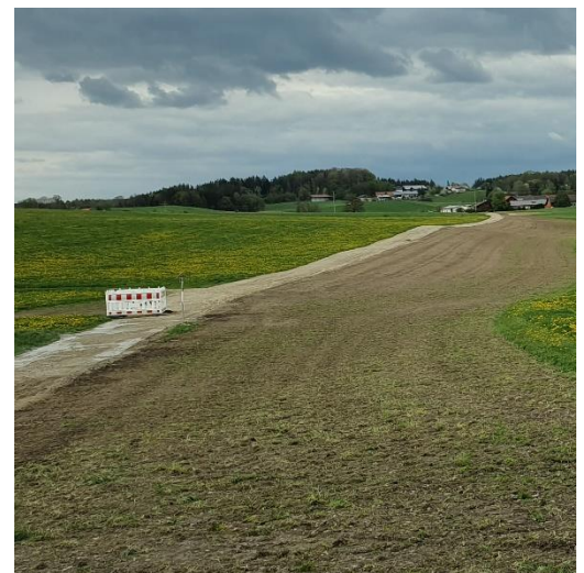
Baumaßnahmen zum Wasserversorgungsverbund in Koblberg