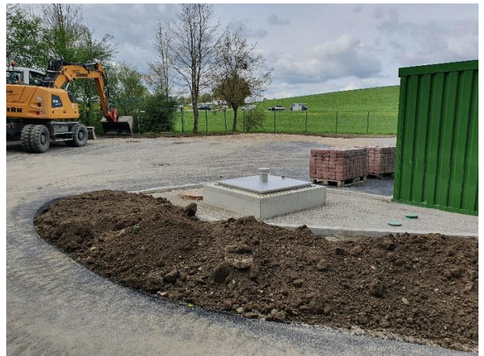
Auf dem Gelände der ehemaligen Teichkläranlage Kirchreit befindet sich nun die neue Pumpstation für die Abwasserentsorgung des Gewerbegebiets Graben sowie des Ortsteils Kirchreit

Ebenfalls im Zeitplan liegt die Umsetzung des Projektes Wasserversorgungsverbund Stadt Wasserburg a. Inn - Gemeinde Soyen - Wasserversorgung der Schlichtgruppe. Während im Bereich Koblberg die Bauarbeiten noch andauern, wurde in Absprache mit den Anliegern das Gelände im Bereich Polln-Reiching nach den Leitungsverlegungsarbeiten bereits wieder hergerichtet.