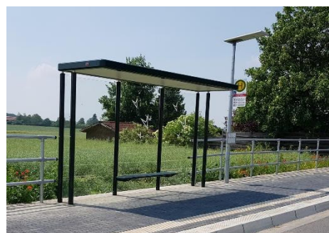
Im Bereich der Bushaltestelle in Maierhof wird eine Solar-Straßenlaterne errichtet