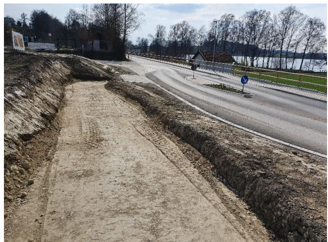
Baufortschritte am Bahnhofsplatz